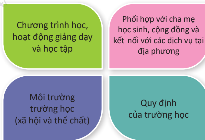
Hình 3: Mô hình trường học nâng cao sức khỏe toàn diện